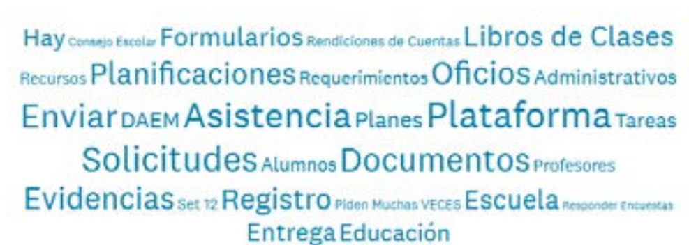
Imagen 1: Análisis de Nube de Palabras Encuesta

La siguiente nube de palabras fue obtenida mediante el análisis de las respuestas de directivos y muestra cuáles son las tareas que les ocupan más tiempo en su realización.