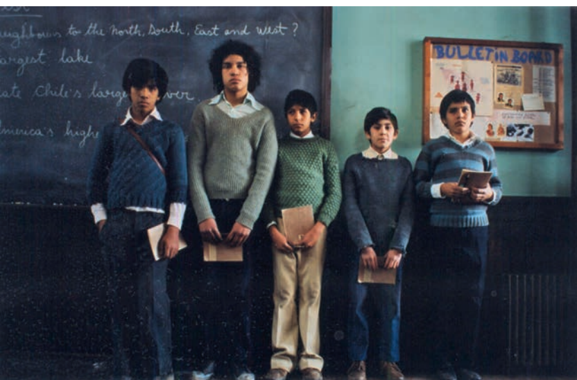
GENTILEZA ANDRÉS WOOD

Una mirada general sobre nuestro sistema escolar revela cuán incrustada está la segregación socioeconómica en nuestro país. Investigaciones recientes, incluyendo los estudios encargados por ESPACIO PÚBLICO, revelan que el sistema educativo chileno tiene un elevado nivel de segregación. En estudios de la OCDE Chile figura de manera consistente como el país con la mayor segregación escolar en relación al nivel socioeconómico de sus estudiantes. Y peor aún, en las últimas tres décadas, la segregación en las escuelas chilenas ha tenido una tendencia al alza.